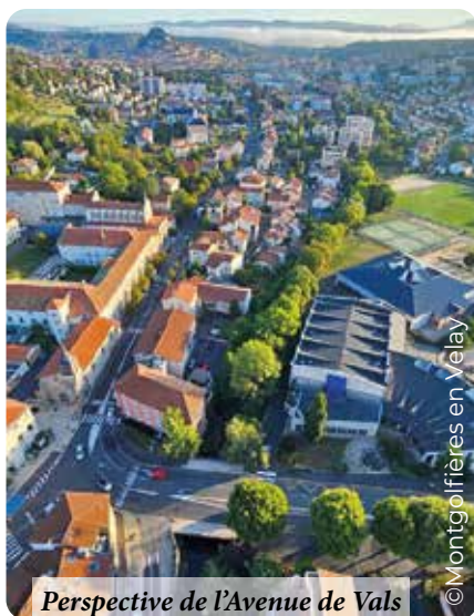
Perspective de l'Avenue de Vals