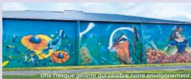
Une fresque géante qui célèbre notre environnement

La commune a également un projet de production d'énergie solaire en autoconsommation collective sur le site des Prés du Pont, vraisemblablement sur le toit du tennis club. Cette initiative vise à partager l'électricité produite avec l'ensemble des bâtiments publics de la commune, tels que l'école, le préau, la mairie et le centre technique. Ce projet est complété par l'étude de la rénovation thermique (isolation par l'extérieur) du bâtiment de la mairie.